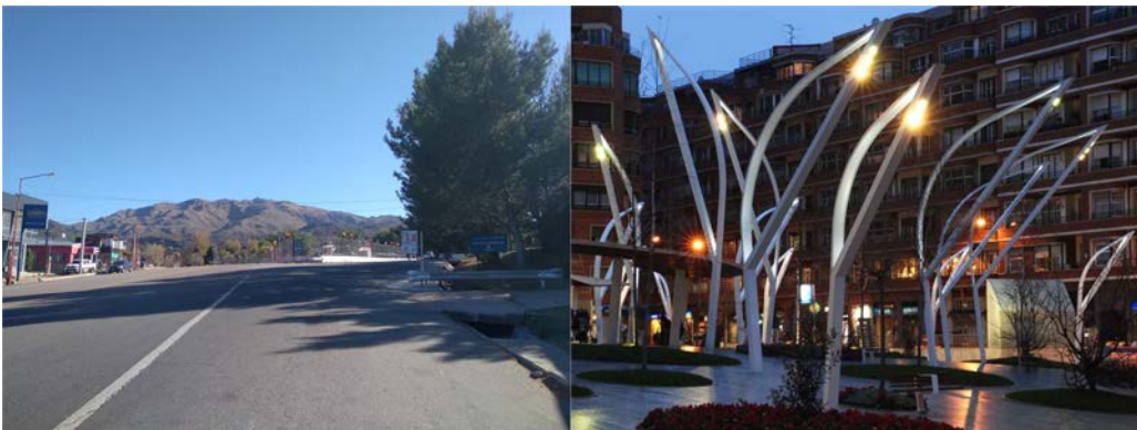
Imagen de Referencia solo para inspirarse.